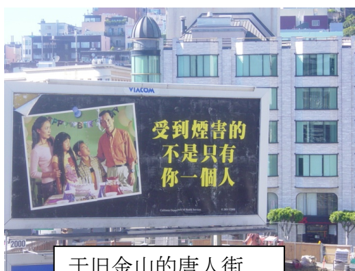
于旧金山的唐人街